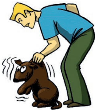
LA PEAU DU COU ET LE SECOUAGE