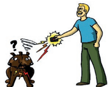
COLLIER ÉLECTRIQUE TÉLÉCOMMANDE