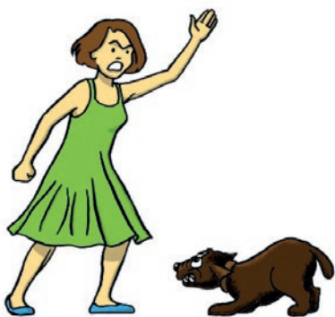
GESTE MENAÇANT DE LA MAIN OU AVEC UN OBJET