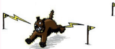
L'ÉLECTRIFICATION PAR COLLIER SUR LE CHIEN