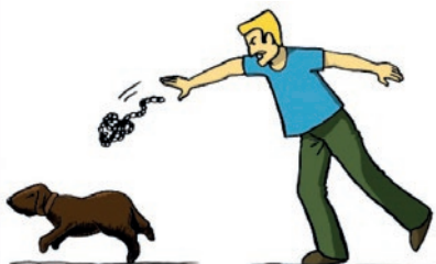
LANCÉ DE CHAÎNE OU D'OBJETS SUR LE CHIEN