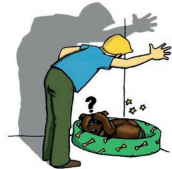
LA PUNITION AVEC COUPS ET CRIS