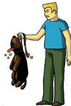
L'ÉTRANGLEMENT OU LA PENDAISON