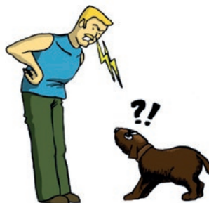
REGARD HIERARCHISANT ET MENAÇANT